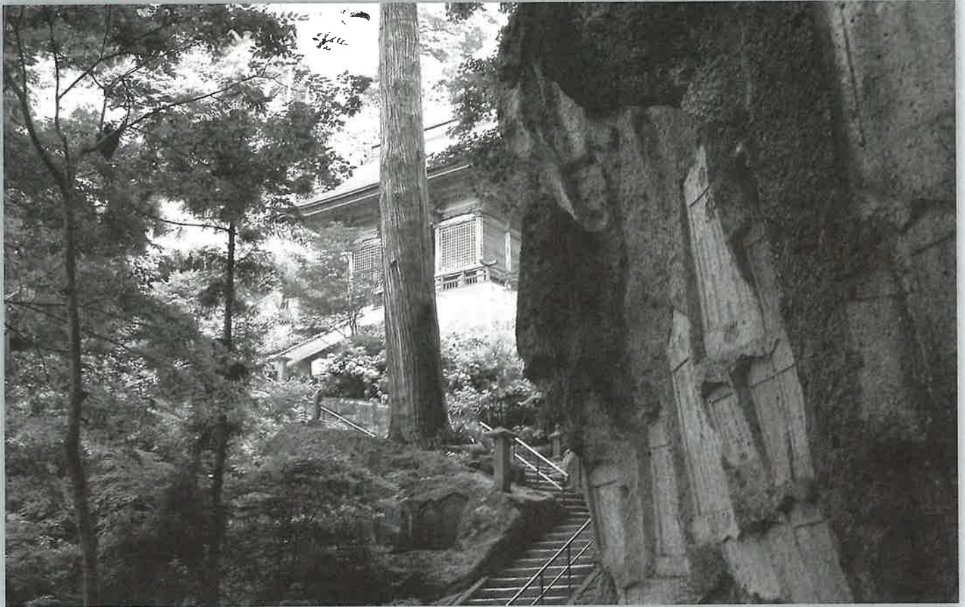
立石寺(山寺)仁王門付近

内容の大意は次のとおり。俳席では無礼にならない程度に世間的礼儀を省略する。付句が重複して出された場合は、句並びの遠い作者を優先する。